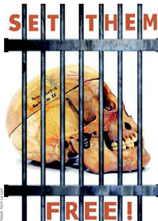
Mit diesem Plakat wurde 2014 die Stiftung Preußischer Kulturbesitz zur Rückgabe geraubter Gebeine aufgefordert

Sein Haupt wurde von den Deutschen vor Ort als Symbol für den gebrochenen Widerstand der Wahehe